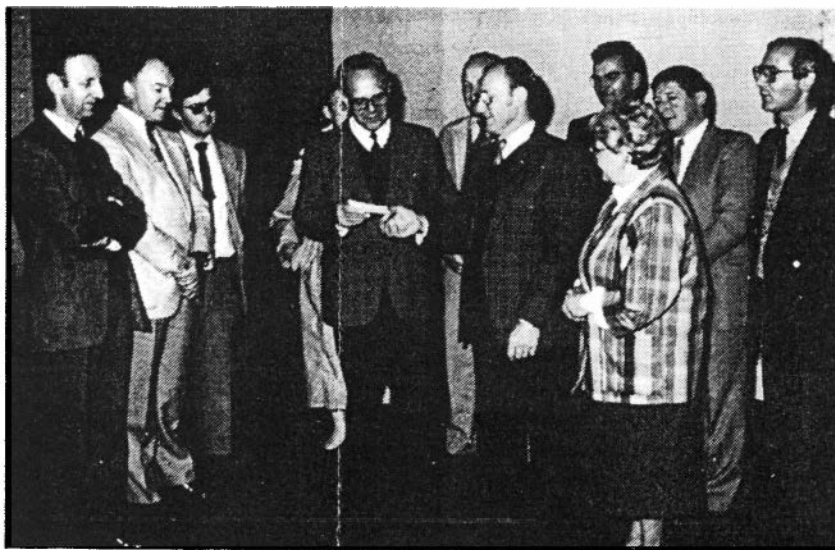
Nu kreeg hij een check ter waarde van 110.000 frank mee. Dat was de opbrengst van het jongste missiefeest in Zingem. De check werd hem enkele dagen vóór zijn afreis overhandigd.

TOMBOLA 1 e NACHT VAN DE RENTEN INGEBOUW