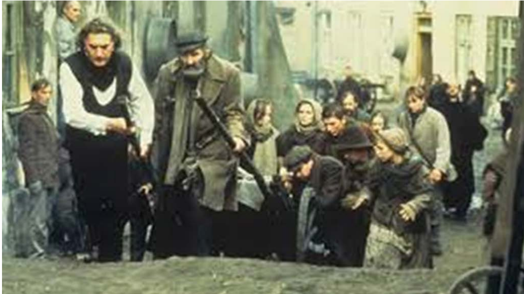
Still uit de film Daens van Stijn Coninx

De meest befaamde Wortegemnaar is ongetwijfeld letterkundige, ondernemer, advocaat en Daensistisch politicus Hector Plancquaert . Getuige daarvan de Plancquaert-herdenking op 6 juni 1970, waarbij te Wortegem het Hector Plancquaert-monument, opgericht door de Vlaamse Toeristenbond, werd ingehuldigd. Getuige daarvan eveneens het H. Plancquaert wandelpad dat er in 1972 werd ingewandeld en de H. Plancquaert fietsroute die op 20 juni 1973 werd ingefietst. En de 21 ste eeuw is hem nog steeds niet vergeten. In maart 2013 werd immers een tenstoonstelling aan hem gewijd, niet toevallig te Aalst, centrum van het Daensisme. In november 2013 organiseerde ook de Wortegemse Heemkundige Kring Bouveloo in het hoevegebouw van de Ghellinck in Elsegem een tentoonstelling onder de titel “150 jaar Hector Plancquaert”.